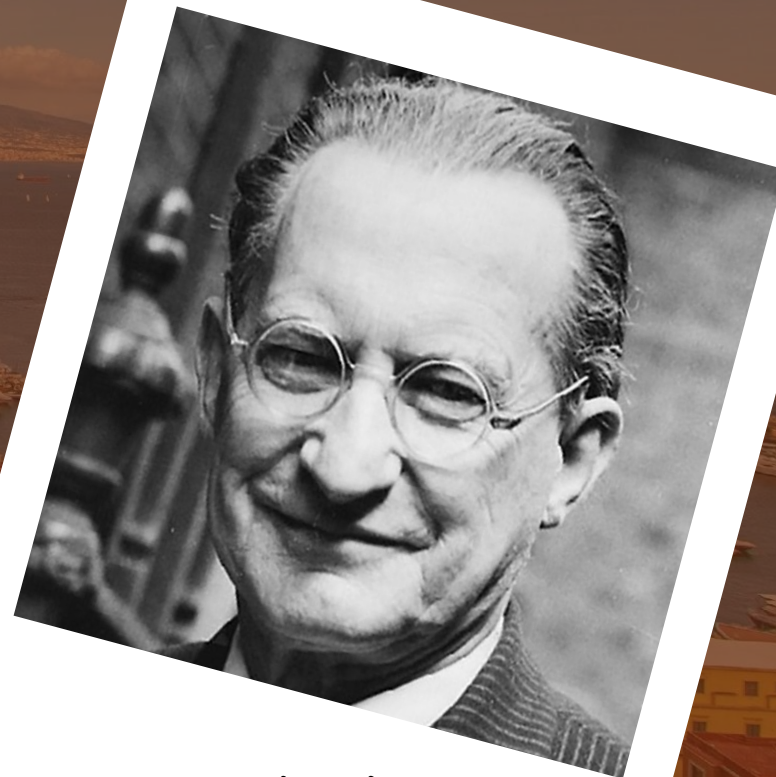
Alcide De Gasperi

Il finanziamento del piano fu stabilito in 100 miliardi di lire all'anno per i dieci esercizi dal 1951 al 1960: in complesso mille miliardi di lire, subito aumentati nel 1952 a 1.280 miliardi da utilizzare nel dodicennio 1951-1962.